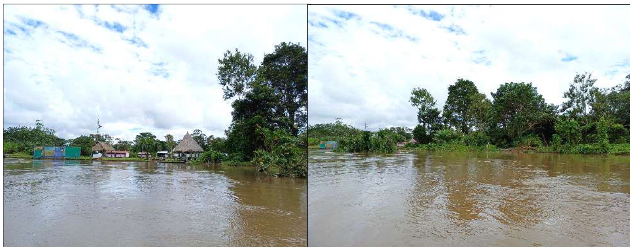
Fotografía N° 3. Río Napo que causa la erosión en el sector, se observa la afectación a áreas de cultivo de la comunidad.