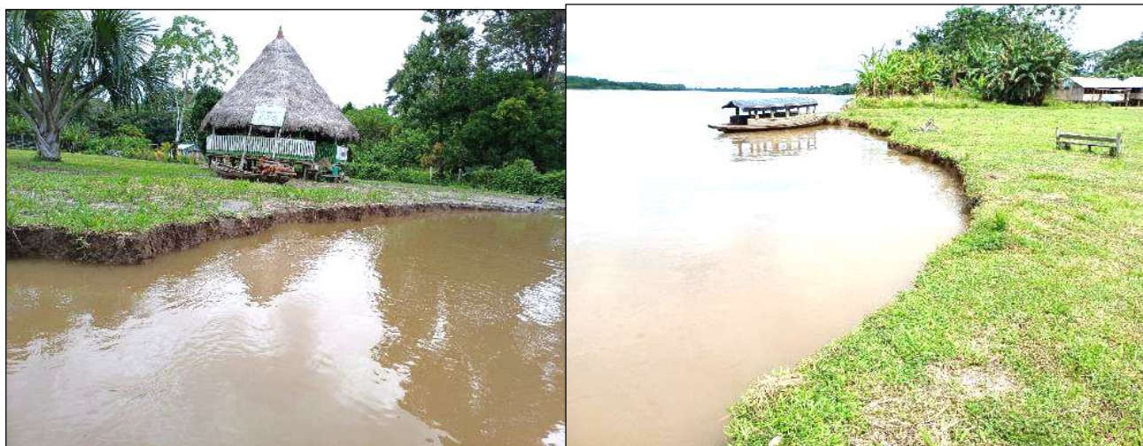
Fotografía N° 2. Maloca comunal y cancha deportiva afectada por la erosión del río Napo.

Ministerio de Desarrollo Agrario y Riego