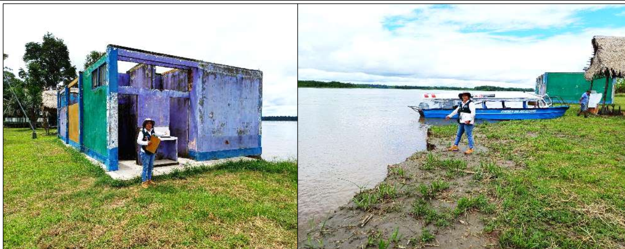
Fotografía N° 1. vista de la erosion del frontis de sector donde se observa la afectación y estructuras abandonadas al borde del barranco.